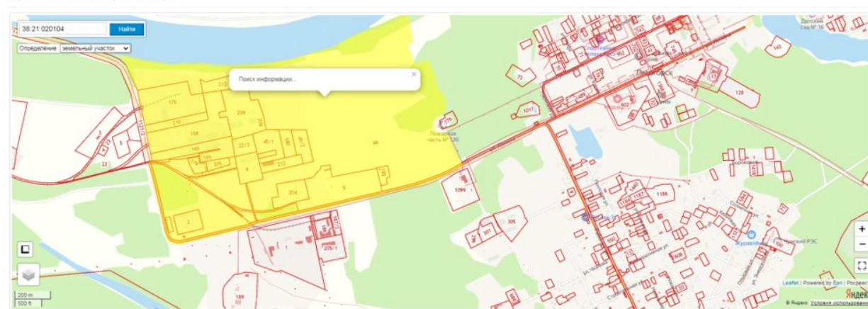
Публичная кадастровая карта

Описание площадки: текущее состояние – свободная