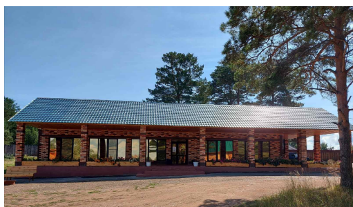
База отдыха «Уютный берег»