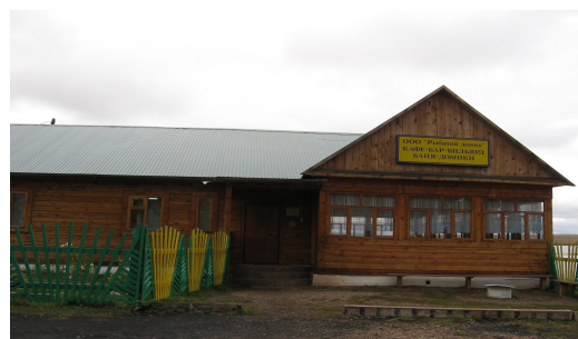
ООО «Рыбачий домик»