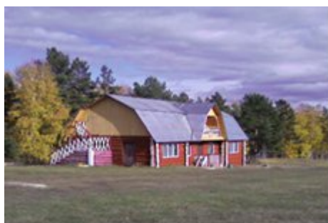
База отдыха «Солнечный берег»

Туристические базы отдыха пользуются большим успехом среди населения Иркутской области. «Рыбачий домик» предлагает истинно русский отдых в бане и возле костра, отдохнуть можно и в удобном домике в березовой роще либо в собственной палатке. Предлагаются экономные варианты проживания в двухместных и четырехместных деревянных домиках. Питаться можно самостоятельно или в столовой турбазы, заказав обед, ужин или комплексное питание. Ведется расширение благоустройства существующей базы отдыха (подвод воды, устройство канализации и освещения).