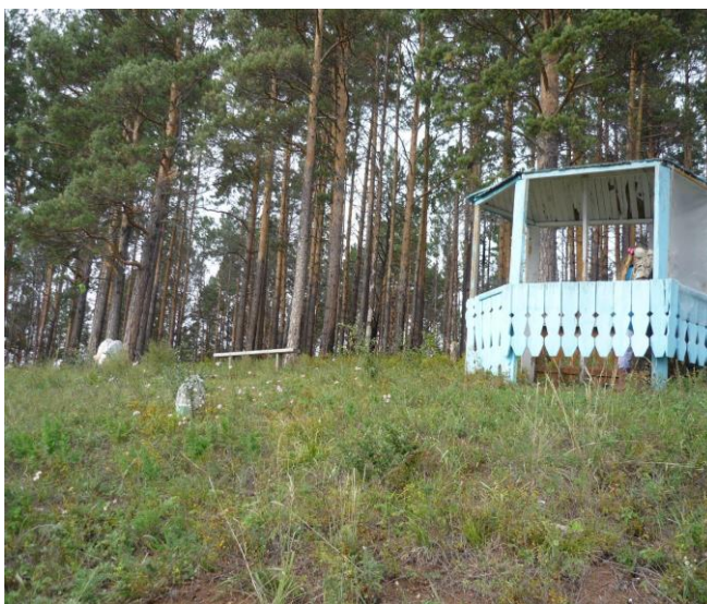
Беседка И.В.Сталина на горе Киткай