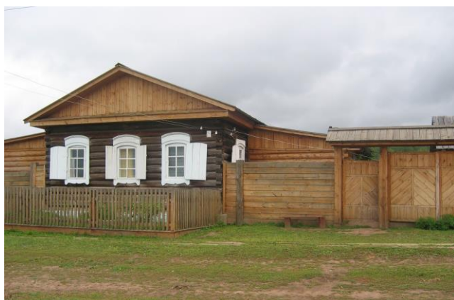
Дом В.Г.Распутина в с.Аталанка