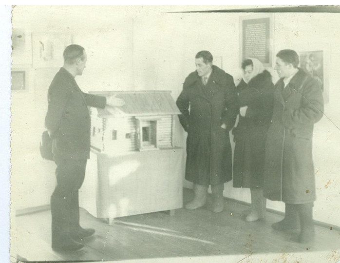
Макет дома, где жил в ссылке И.В.Сталин в с.Новая Уда