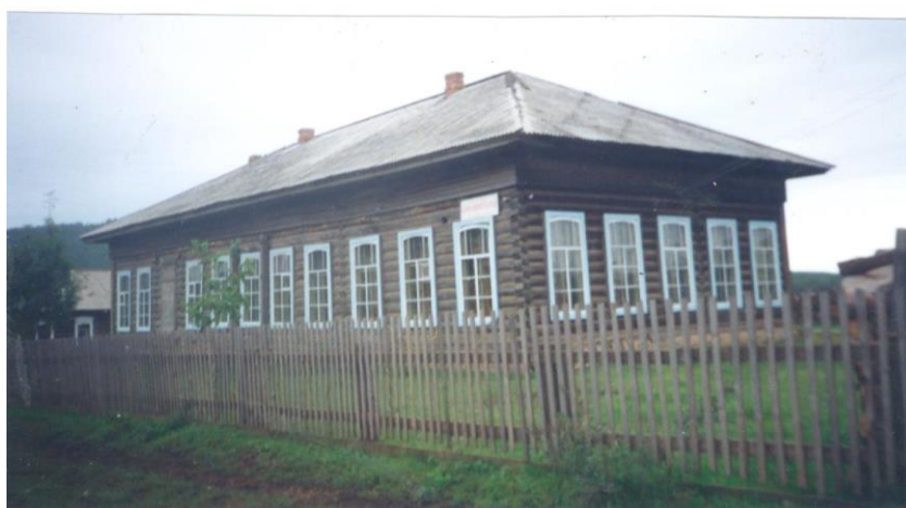
Волостная управа в с.Новая Уда, куда ходил отмечаться В.И.Сталин во время ссылки