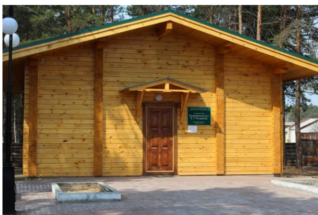
Выставочный зал В.Г.Распутина в п.Усть-Уда