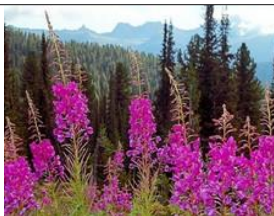
Кипрей узколистный (иван-чай)